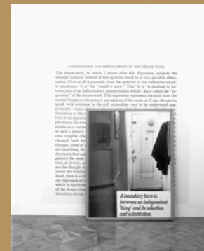
Joseph Kosuth, »O.&A./FID!(TO I. K. AND G. F.)«, Siebdruck, Fotografie gerahmt, 1987.