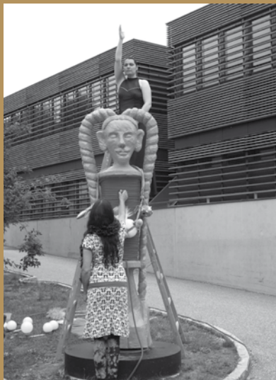
Rechts: Luisa Kasalicky, o. T., Installationsansicht, 2011. © Bawag Contemporary, Foto: Oliver Ottenschläger